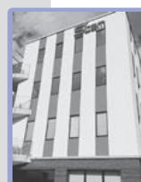
調査分析センター