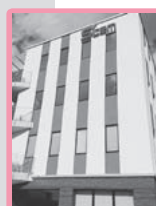
調査分析センター